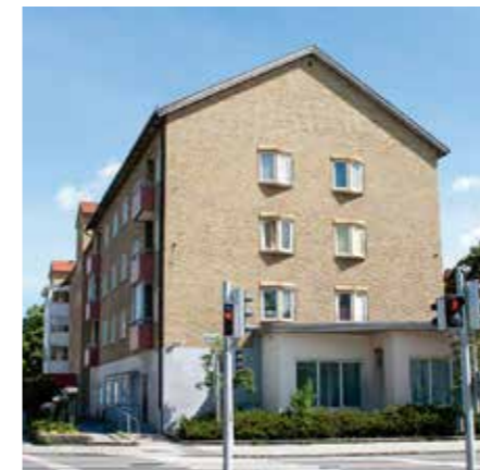
MKB Fastighets AB, Malmö