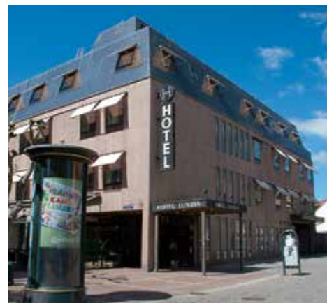
Hotell Lundia, Lund