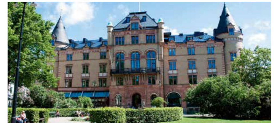
Grand Hotell, Lund