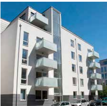
Kryddhuset Drottningtorget, Malmö