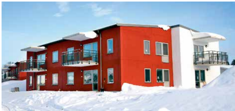
JSB Trygga Boendet