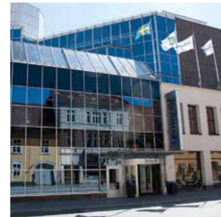
Radisson Blu Hotel, Malmö