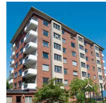
Brf Krageholm, Malmö

Vill du veta mer om ett specifikt projekt är du varmt välkommen att höra av dig.