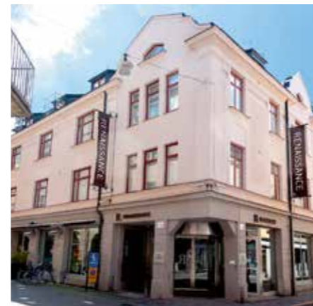
Marriott, Renaissance Malmö Hotel