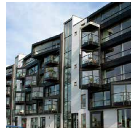
Vindöga Västra Hamnen, Malmö