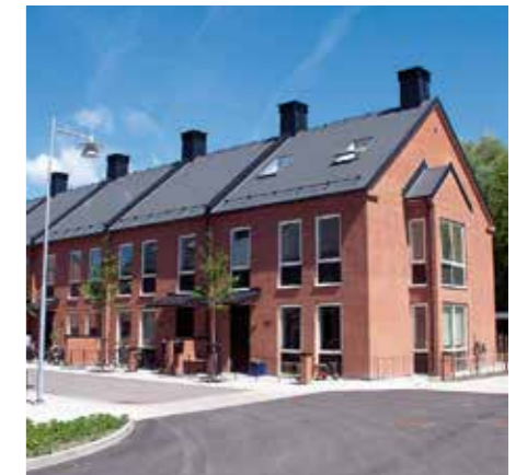
Riksbyggen, Kv Källby Lund